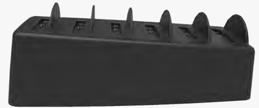
Base del cargador con 6 bahías

Conecte el DuraCase a cualquiera de las Bases del cargador GDS® o Adaptador del cargador. Los contactos exteriores de la base están diseñados específicamente para tener una base y una carga segura de ambos dispositivos en DuraCase. Las bases del cargador están diseñadas para resistir conexiones y desconexiones repetidas de la base. Los imanes incorporados posicionan el DuraCase y mantienen la estación de base en el lugar. Eficaz para cargar uno o muchos dispositivos.