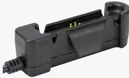
Adaptador del cargador