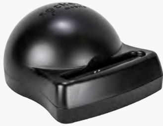
Base del cargador