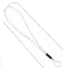
セキュリテイ ケーブル