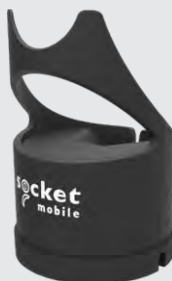
充電ドック SKU# AC4133-1871