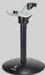
充電スタンド SKU# AC4076-1538