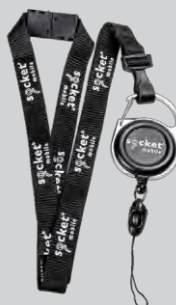
ネックストラップ - Black AC4100-1692